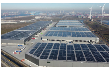
Smartlog Maasvlakte, Países Bajos Poder instalado: 25 MWp Inicio operación: 05/2022

GOLDBECK SOLAR es su especialista en cubiertas planas.