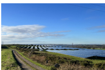
Lurig, Irlanda Poder instalado: 5,2 MWp Puesta en servicio: 06/2022