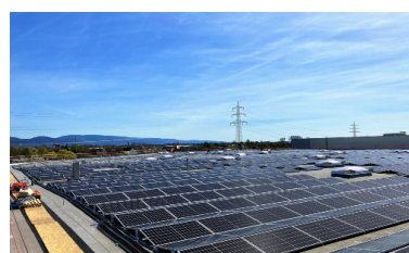
Rheinenergie, Alemania Poder instalado: 3,750 kWp Inicio operación: 03/2022