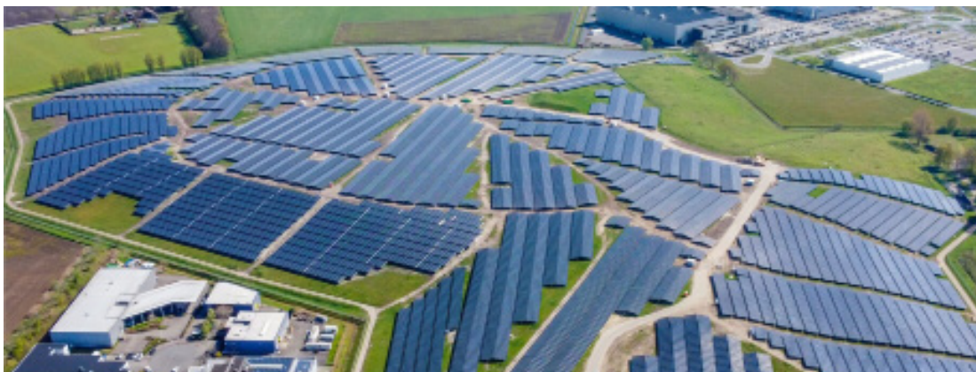
Bavelse Berg, Países Bajos Poder instalado: 37.000 kWp Puesta en servicio: 03/2021

Desde sistemas fotovoltaicos a partir de 6 MWp hasta proyectos a gran escala de más de 100 MWp, somos su contacto para la implementación y el soporte profesional.