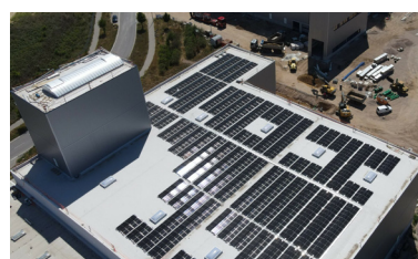
Greiwing Worms, Alemania Poder instalado: 675 kWp Inicio operación: 11/2022