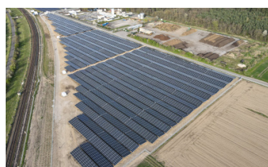
Bruhrain, Alemania Poder instalado: 6.166 kWp Puesta en servicio: 04/2022