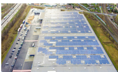
Logicor Gelsenkirchen, Alemania Capacidad instalada: 745 kWp Inicio operación: 03/2022